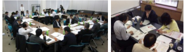
写真はUCDAアワード2013評議会の様子

「UCDAアワード」は、企業・団体が生活者に発信するさまざまな情報媒体を、産業・学術・生活者の知見により開発した尺度を使用して「第三者」が客観的に評価し、優れたコミュニケーションデザインを表彰するものです。