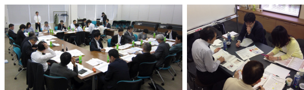
写真はUCDAアワード2013評議会の様子

「UCDAアワード」は、企業・団体が生活者に発信するさまざまな情報媒体を、産業・学術・生活者の知見により開発した尺度を使用して「第三者」が客観的に評価し、優れたコミュニケーションデザインを表彰するものです。