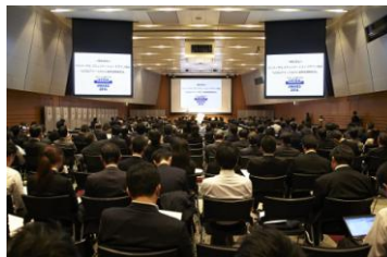
写真はUCDAアワード2014選考結果報告会会場の様子

「UCDAアワード」は、企業・団体が生活者に発信するさまざまな情報媒体を、産業・学術・生活者の知見により開発した尺度を使用して「第三者」が客観的に評価し、優れたコミュニケーションデザインを表彰するものです。