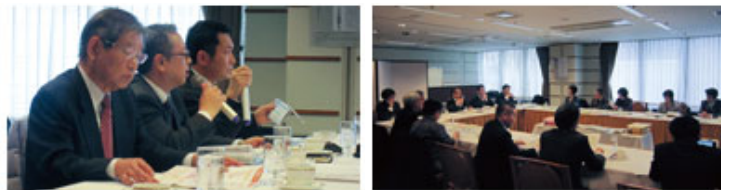
写真はUCDAアワード2011評議会

「UCDAアワード2012」は、企業が発信する情報を、産業・学術・生活者の知見により開発した尺度を使用して、「第三者」が客観的に評価・表彰するものです。UCDAは評価結果が改善のための指標となり、デザイン技術の発展とコミュニケーション品質の向上を通じて、企業と生活者双方の利益に貢献することを目指します。