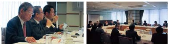
UCDAアワード2011評議会の様子

「UCDAアワード2012」は、企業が発信する情報を、産業・学術・生活者の知見により開発した尺度を使用して、「第三者」が客観的に評価・表彰するものです。UCDAは評価結果が改善のための指標となり、デザイン技術の発展とコミュニケーション品質の向上を通じて、企業と生活者双方の利益に貢献することを目指します。