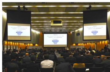
UCDAアワード2015選考結果報告会会場の様子

「UCDAアワード」は、企業(団体)・行政が生活者に発信するさまざまな情報媒体を、産業・学術・生活者の知見により開発した尺度を使用して「第三者」が客観的に評価し、優れたコミュニケーションデザインを表彰するものです。